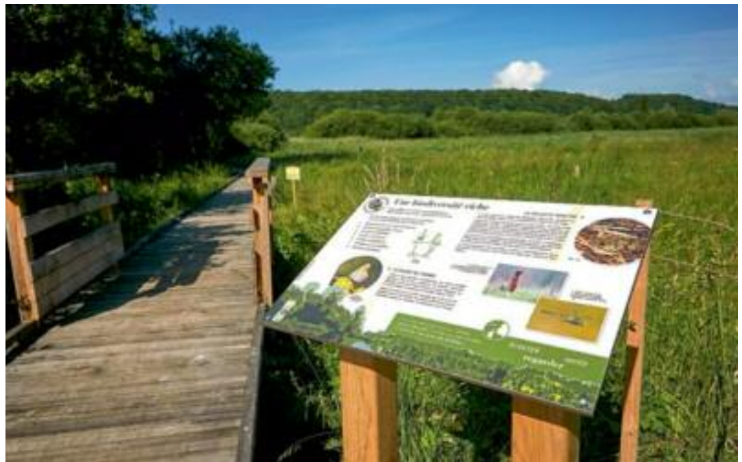
Le Conseil départemental participe, à son échelle, à la lutte contre le réchauffement climatique et à la protection de l'environnement. Il mène des actions tant internes que dans les territoires.

Autre axe fort de l'action départementale : la préservation ou la restauration de la qualité de l'eau. Un travail mené en lien avec l'agence de l'eau, les services de l'État, les syndicats de bassin versant... "Le Conseil départemental accompagne les collectivité